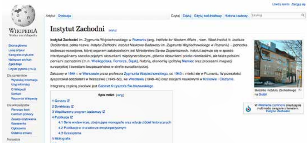
Fot. 3 Zdjęcie ze strony wikipedia.org z opisem Instytutu Zachodniego.

3.2. posiadać będzie wizytówkę organizacji w google dla firm.