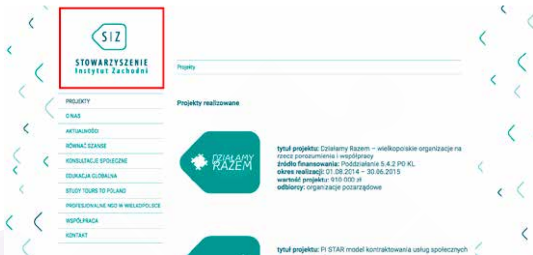
Fot. 2 Foto logotypu ze strony www.siz.poznan.pl

1.3. wyeksponowanie logotypu organizacji na stronie (wersja graficzna i opis zdjęcia z nazwą organizacji, oraz w samej nazwie pliku) np.